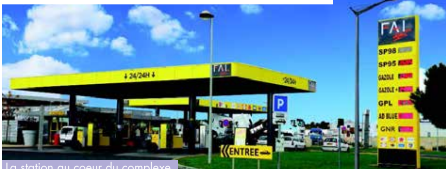
La station au coeur du complexe

Le parking s'étend sur 7 hectares avec 350 places, il accueille les poids lourds mais aussi les véhicules et les autobus.