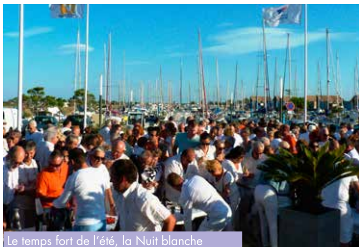
Le temps fort de l'été, la Nuit blanche du Pavillon bleu.

Cette année encore et pour la 7 ème fois consécutive, le port s'est vu attribuer le label européen Pavillon bleu , pour ses efforts en matière environnementale : la prévention des pollutions, le traitement des déchets, la distribution de produits écologiques aux plaisanciers pour leurs bateaux.