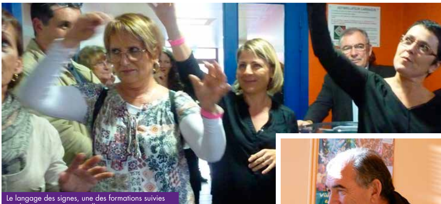
Le langage des signes, une des formations suivies par les assistantes maternelles

«Il est grand temps de se pencher sur le volet social»