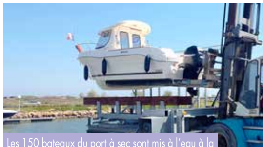
Les 150 bateaux du port à sec sont mis à l'eau à la demande de leurs propriétaires.

Un nouvel ascenseur a été installé, permettant de sortir des bateaux de 3,5 tonnes, d'une longueur maximum de 8m, équipé d'un treuil électrique et le périmètre d'action de la machine a été sécurisé. Cet équipement mis à disposition du port à sec d'un montant de 150 000 € HT (aide de 30% du Département de l'Hérault) fonctionne toute l'année, sauf en janvier.