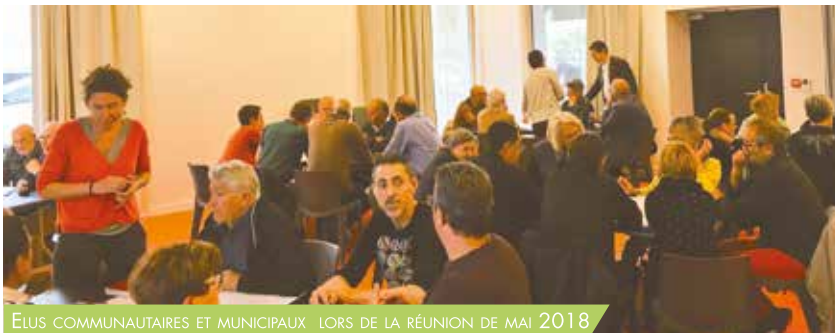
ELUS COMMUNAUTAIRES ET MUNICIPAUX LORS DE LA RÉUNION DE MAI 2018