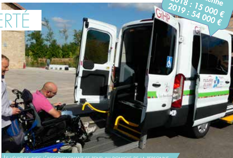
LE VÉHICULE AVEC L'ACCOMPAGNANT SE REND AU DOMICILE DE LA PERSONNE

GIHP* : Groupement pour l'Insertion des personnes Handicapées Physiques.