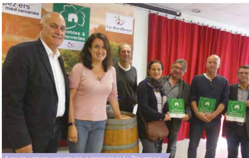
AVEC LES ACTEURS LABELISÉS SUR LE TERRITOIRE DE LA DOMITIENNE

16.000 hectares de vignes labellisées 53.000 dégustations 200 km de sentiers VTT et rando pédestres