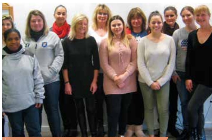
LES CANDIDATES À LA FORMATION DANS LES MAISONS DE RETRAITE

2 600€/ an pour les jeunes obtention BAFA