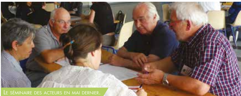
LE SÉMINAIRE DES ACTEURS EN MAI DERNIER.