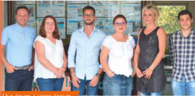
UNE ÉQUIPE À VOTRE ÉCOUTE

Au bord du Canal du Midi, poussez la porte et venez concrétiser votre rêve. L'agence propose un grand choix de biens à la vente, à la location et assure un service qualitatif de gestion locative, dans les communes de La Domitienne.