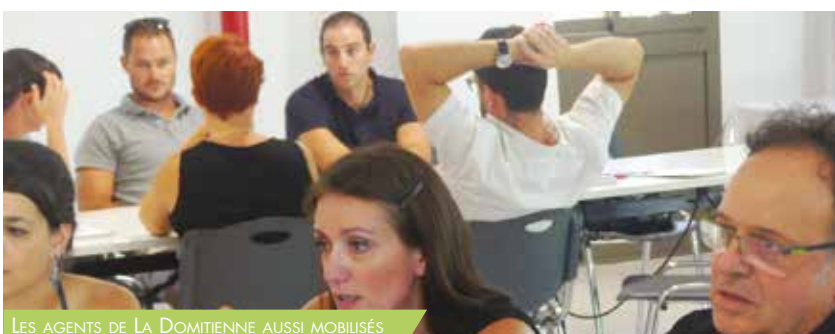
LES AGENTS DE LA DOMITIENNE AUSSI MOBILISÉS