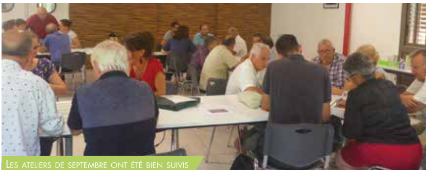
LES ATELIERS DE SEPTEMBRE ONT ÉTÉ BIEN SUIVIS