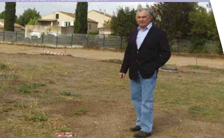
APRÈS 8 MOIS DE TRAVAUX, TROIS CABINETS MÉDICAUX ET UNE PHARMACIE DE 300 M 2 DEVRAIENT OUVRIR, DÈS L'ÉTÉ PROCHAIN

Tons clairs, rayonnages impeccables, la cave à bière a trouvé toute sa place et répond aux nouvelles tendances de consommation.