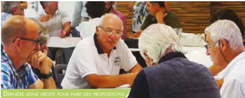
DERNIÈRE LIGNE DROITE POUR FAIRE DES PROPOSITIONS

LA DOMITIENNE A LANCÉ SON PLAN CLIMAT, EN Y ASSOCIANT UN LARGE PANEL D'ACTEURS DU TERRITOIRE. LA CONSTRUCTION DU PLAN CLIMAT AIR ENERGIE TERRITORIAL S'ÉLABORE : VOICI LA RÉTROSPECTIVE SUR L'ANNÉE 2018