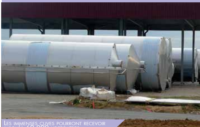
LES IMMENSES CUVES POURRONT RECEVOIR JUSQU'À 60.000 HECTOLITRES

Ses travaux d'implantation avancent à grands pas. Dans quelques mois seront expédiés chaque semaine 60 000 hl de vin, qui transiteront non pas par la route mais par le fret ferroviaire.