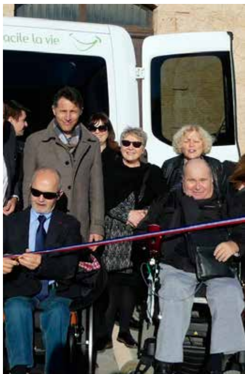
*GIHP GROUPEMENT POUR L'INSERTION DES PERSONNES HANDICAPÉES PHYSIQUES

Le véhicule du GIHP mis à la disposition des personnes en situation de grand handicap, circule quotidiennement sur le territoire de La Domitienne, depuis octobre dernier. Ce service soutenu par la communauté de communes, répond à une réelle attente. Dès le mois de novembre, 31 missions ont été assurées. Lors de son inauguration à Colombiers, certains usagers présents ont pu dire combien ce véhicule avait changé leurs vies.