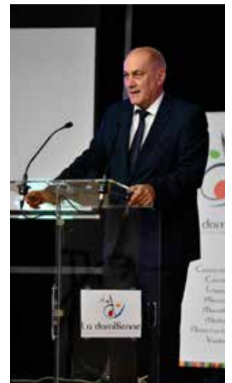
LE PRÉSIDENT ALAIN CARALP

La toute nouvelle salle Claude Nougaro à Montady a servi d'écrin à la cérémonie de La Domitienne. En présence des élus communautaires, des représentants de l'Etat, du Département et de la Région, Alain Caralp a adressé ses vœux devant une salle comble. Extraits de son discours.