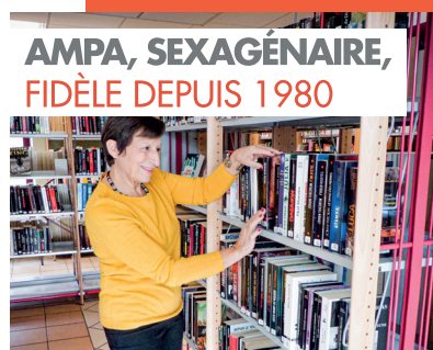
AMPA, SEXAGÉNAIRE, FIDÈLE DEPUIS 1980

Quand on aime lire on va à la médiathèque mais pas seulement. On peut aussi voir des spectacles, du cinéma, des expositions, participer à des ateliers, rencontrer des auteurs... En fait on ne cesse de s'enrichir tout en passant du bon temps. Lieu d'échanges entre générations, on partage aussi des émotions. Alors pourquoi s'en priver ?