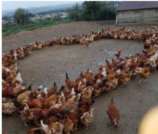
La Ferme Fabiole Route de Poussan - Maraussan - 06 98 33 77 91

L'avicultrice a aussi créé une gamme de produits finis réalisés par ses soins. Pour cela, elle a fait bâtir 400 m 2 de bâtiments équipés d'une chaîne d'abattage, d'un laboratoire, de deux chambres froides et d'un magasin. À la vente, on y trouve une déclinaison infinie de produits à base de poulet, sous toutes ses formes. « Avec notre production de poulets fermiers et on tourne à plein régime. Et comme je veux garder la qualité premium de mes produits, je ne produirai pas davantage, même si je ne peux pas satisfaire ma clientèle. »