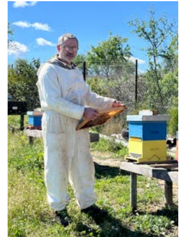
Les miels de Didier Diego 06 78 18 85 46

400 kg de nectar transformés magiquement en miel par ces travailleuses inlassables, ont été récoltés en six variétés différentes, de mai à la fin de l'été. « Selon le miel voulu, je place les abeilles, dans le Caroux pour le miel de châtaignier, dans la garrigue ou sur les hauteurs de Lespignan pour le miel de fleurs etc.»