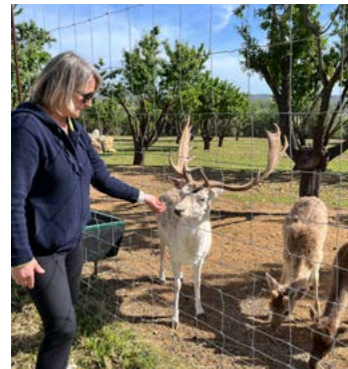
Les amandiers de la garrigue www.lesamandiersdelagarrigue.com ou 06 84 13 17 90