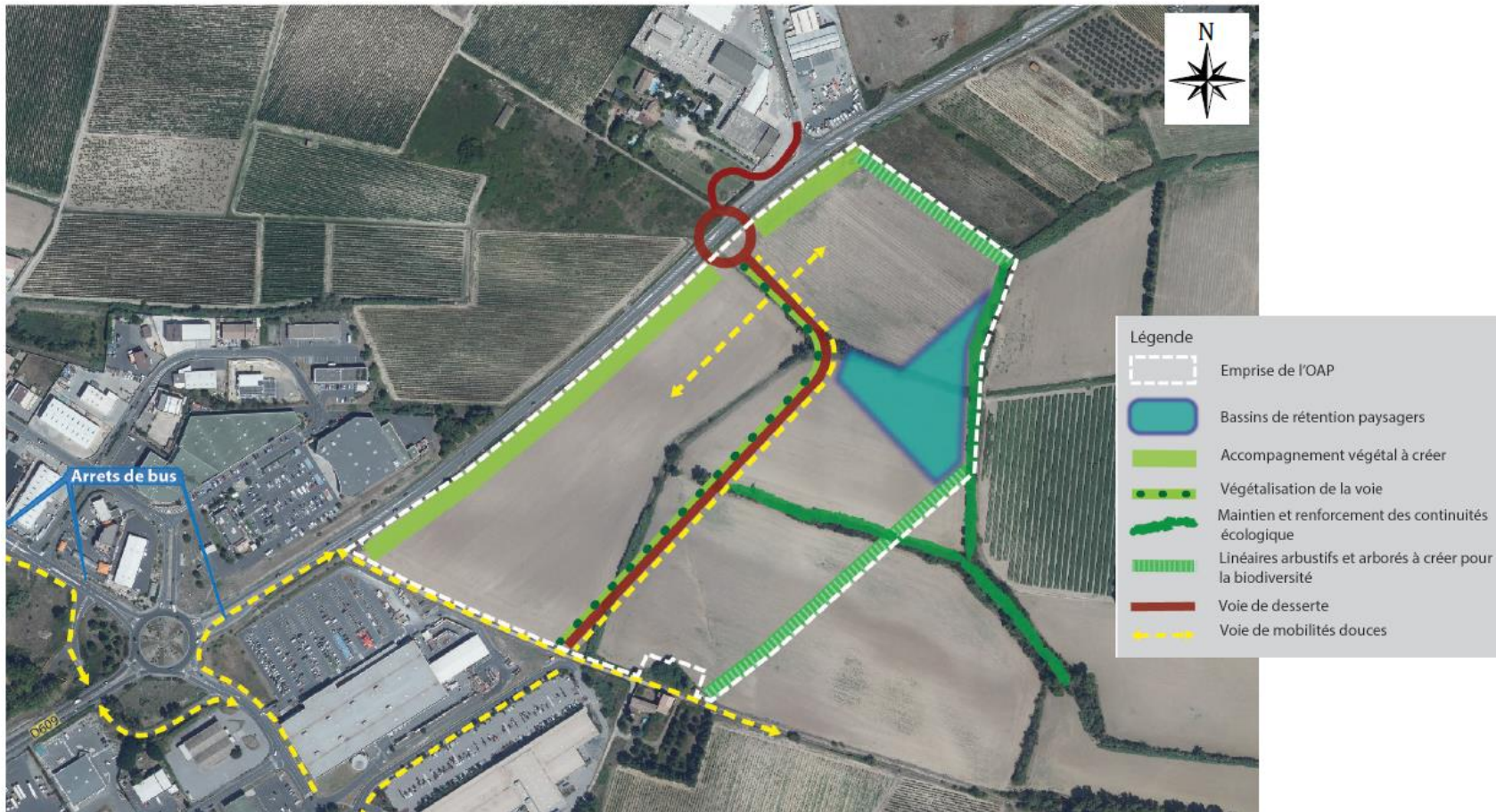
Schéma d'aménagement précisant les principales caractéristiques de l'organisation spatiale du secteur

Nota : le schéma d'aménagement permet une souplesse dans son application. Les formes délimitées ne préfigurent qu'une intention à retranscrire dans le projet d'aménagement.