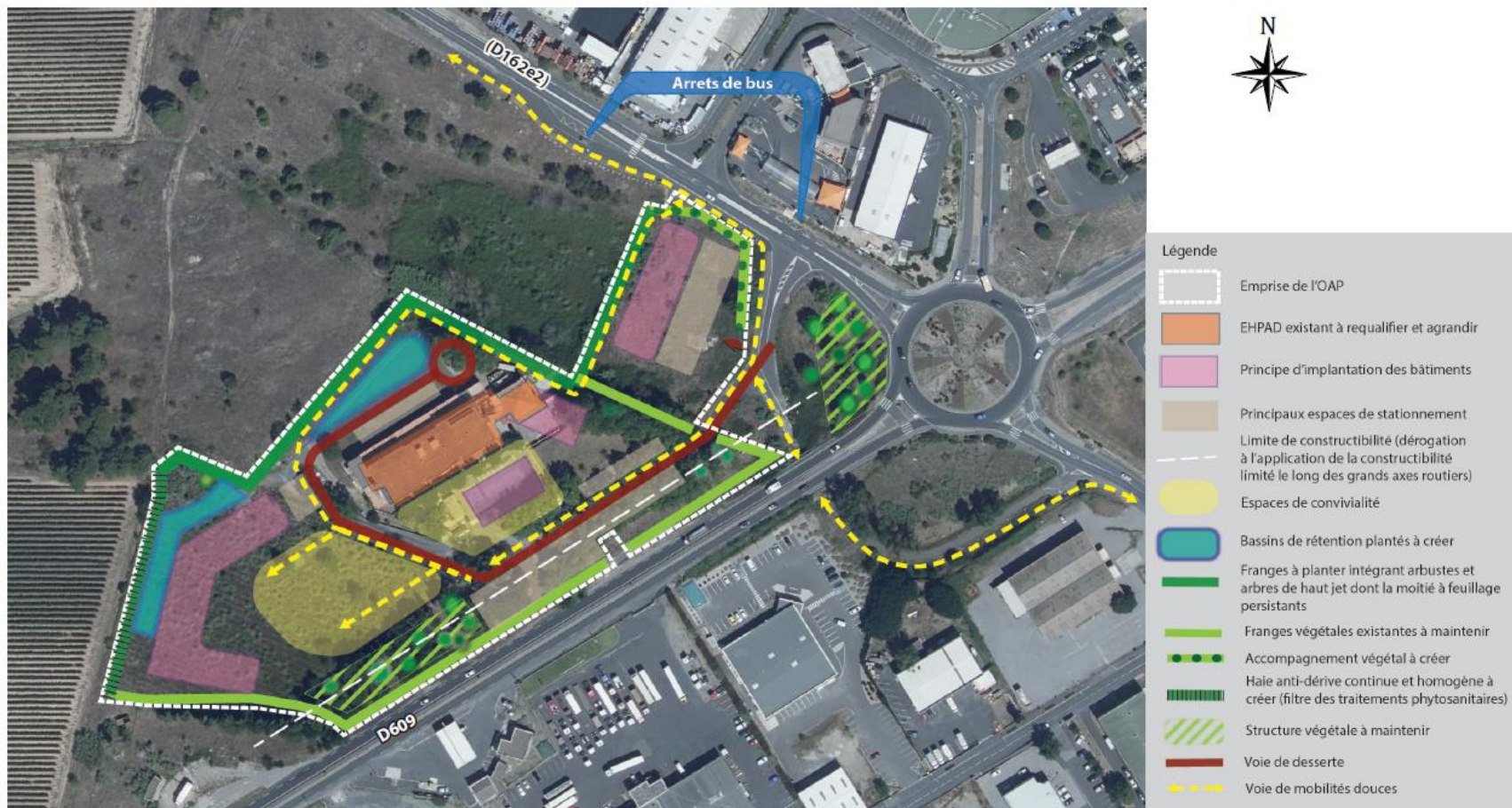
Schéma d'aménagement précisant les principales caractéristiques de l'organisation spatiale du secteur

Nota : le schéma d'aménagement permet une souplesse dans son application. Les formes délimitées ne préfigurent qu'une intention à retranscrire dans le projet d'aménagement.