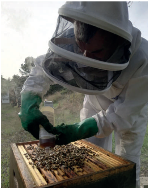
Sur les marchés locaux et Facebook : la vallée du miel

Élevage, hivernage, transhumance du cheptel, une histoire de miellées.