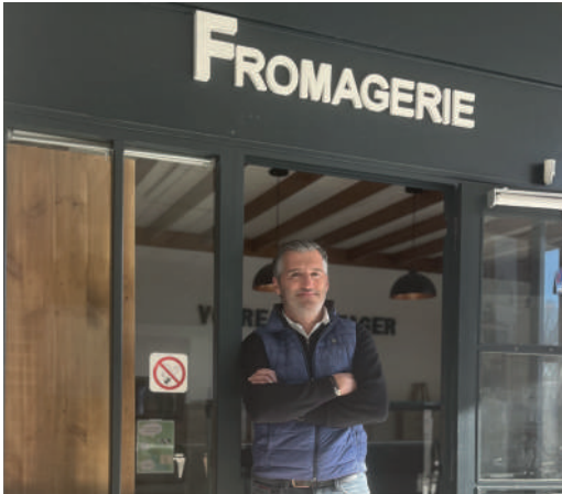
Boutique de vente ZI La Plaine des Astres - Montady 04 67 26 62 52

Avec ses 1 200 références, La Compagnie des Fromagers, sans concurrence sur le marché régional, surfe sur le succès.