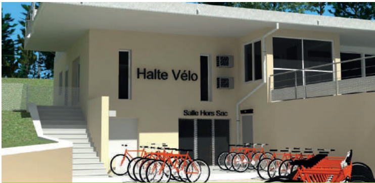
Projection du bâtiment après travaux

Le territoire, au travers de l'Office de Tourisme souhaite poursuivre sa dynamique de déploiement des modes de circulation doux, durables et respectueux de notre patrimoine.